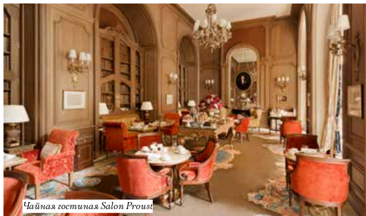
Чайная гостиная Salon Proust